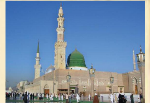
Al-Masjid al-Nabvi “A Mesquita do Profeta” (imagem na capa e em cima), situada na cidade de Medina. O complexo da mesquita abriga o lugar de descanso final do Sagrado Profeta (que a paz e bênçãos de Deus estejam com ele). A mesquita é considerada o segundo local mais sagrado do Islão e uma das maiores mesquitas no mundo.

O Sagrado Profeta saw faleceu em 622 d.C. deixando para trás uma comunidade justa e devota de crentes que deram continuidade à sua missão de espalhar o Islão em todos os cantos do mundo apesar dos grandes obstáculos. Hoje, existem mais de cem mil milhões de Muçulmanos em todo o mundo.