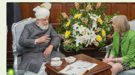
Exma. Theresa May, Primeira-Ministra do Reino Unido

Sua Santidade reúne-se regularmente com os presidentes, primeiros-ministros, outros chefes de Estado, deputados e embaixadores do estado. Ele proferiu palestras no Parlamento do Reino Unido, na Colina do Capitólio, no Parlamento Europeu, no Parlamento holandês e no Parlamento da Nova Zelândia, enfatizando a necessidade de justiça absoluta.