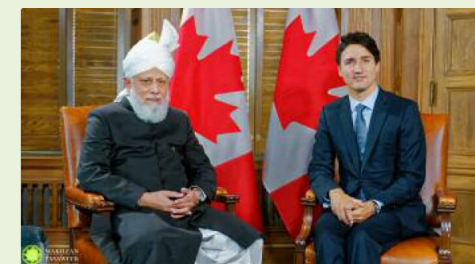
Exmo. Justin Trudeau, Primeiro-Ministro do Canadá