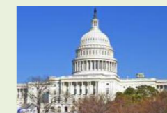
Colina do Capitólio, Washington, EUA