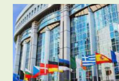
Parlamento Europeu, Bruxelas, Bélgica