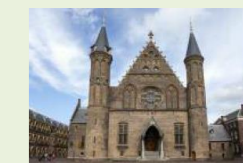
Parlamento Holandês, Haia, Holanda