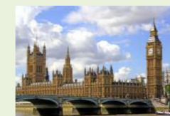
Câmara dos Comuns, Londres, Reino Unido